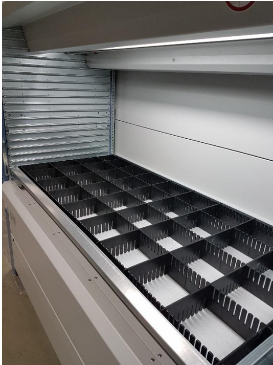
Kardex Shuttle ingericht

Korting bij volumes : mail voor een scherpe aanbieding naar info@hagisto.nl